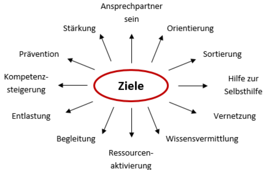
Abbildung 1: Ziele der Familien- und Erziehungsberatung

Unsere primäre Aufgabe ist es, die Familien auf ihrem Lösungsweg zu begleiten und ihnen Hilfe zur Selbsthilfe zu gewähren. Wir sind Ansprechpartner für alle Problematiken, die sich hinsichtlich der Entwicklung und des menschlichen Zusammenlebens innerhalb einer Familie und dem engeren Umfeld ergeben können.